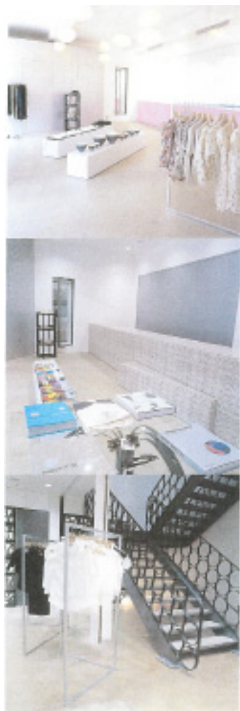
Brutus Casa May 2002

tokyo NEW SHOP 東京を パワフルにする ニューショップ この店舗は、東京のパワフルなイメージを演出するために、最新のデザインと、高品質な素材が特徴で、大人のファッション愛好家にとって、まさに理想の空間である。